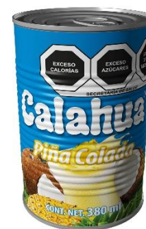
Lata de metal 380 gramos

Nuestra Piña Colada Calahua® es una bebida lista para beber para disfrutar de la auténtica piña colada, mezcla de jugo de piña y la original crema de coco Calahua.