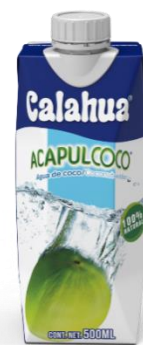
Tetra Prisma 500 ml

Acapulcoco es agua de coco 100% natural extraída de los mejores cocos jóvenes de México. Es una bebida hidratante e isotónica baja en calorías, con minerales como; potasio, magnesio, calcio y fósforo. NO GMO. Elaborado con los mejores estándares de fabricación. FSCC2200, SMETA 4 PILARES, entre otros